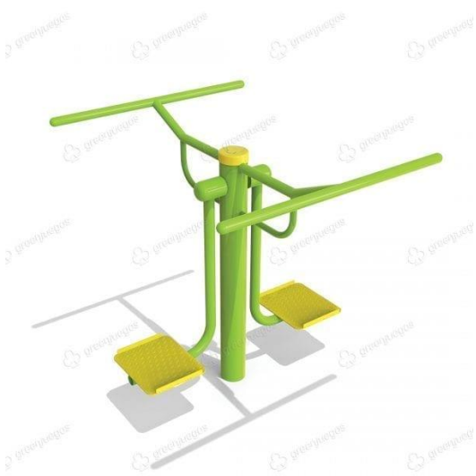
Bamboleo cintura doble