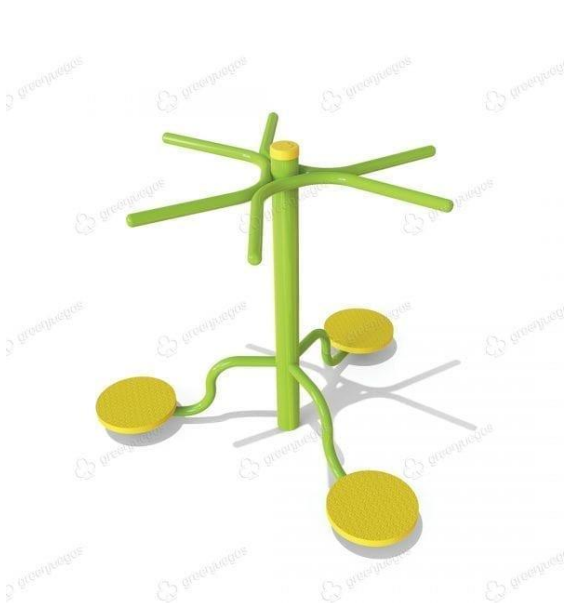
Relajador cintura triple vaivén