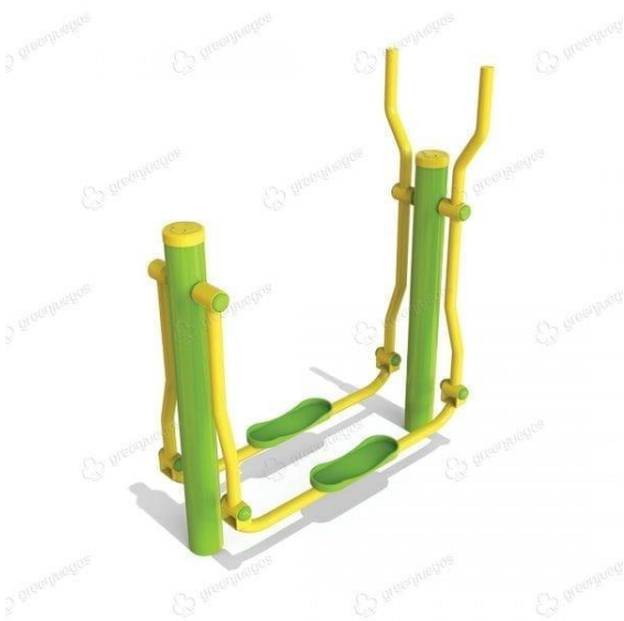
Pedales con remo

Se establece un adelanto al momento de la adjudicación y contratación de la obra y el saldo restante contra su entrega final.